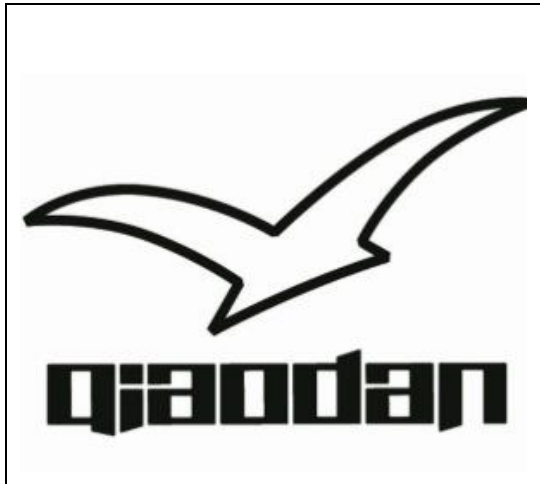
図 4 ピンイン「qiaodan」と図形の組合せ商標

これら計 7 件の判決では、それら商標の登録はマイケル・ジョーダンの先行氏名権を侵害していないとの判断が下された。理由は、以下のとおりである。